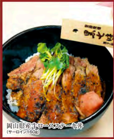
岡山県産牛ロースステーキ丼 (サーロイン160g)

特選岡山県産牛スモールカットステーキと 秋野菜盛り合わせ(サーロイン200g or ファイル160g) …… ￥3,980 サラダ、御飯、吸物、デザート、コーヒー付き