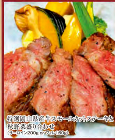
特選岡山県産牛スモールカットステーキと 秋野菜盛り合わせ (サーロイン200g or ファイル160g)